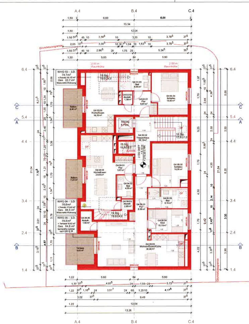
Grundriss 2. Obergeschoss