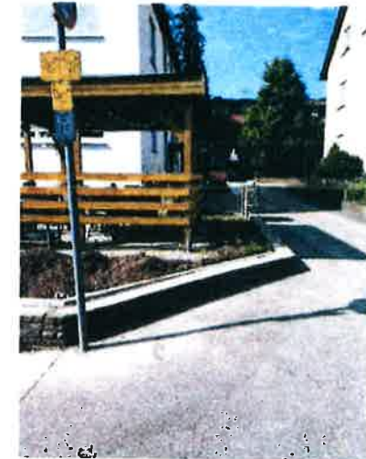
Bemaßung Ostseite zum Verbindungsweg Hauseingang:

Natursteinmauer Breite 32 cm Natursteinmauer Höhe 30 cm