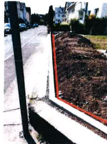
Bemaßung Südseite zum Gehweg Friedrichstraße:

Natursteinmauer Breite 32 cm Natursteinmauer Höhe 30 cm